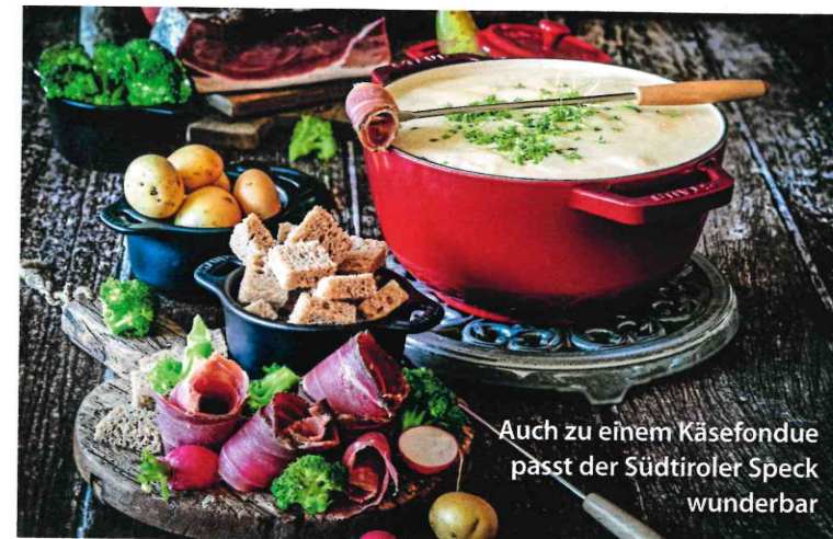
Auch zu einem Käsefondue passt der Südtiroler Speck wunderbar