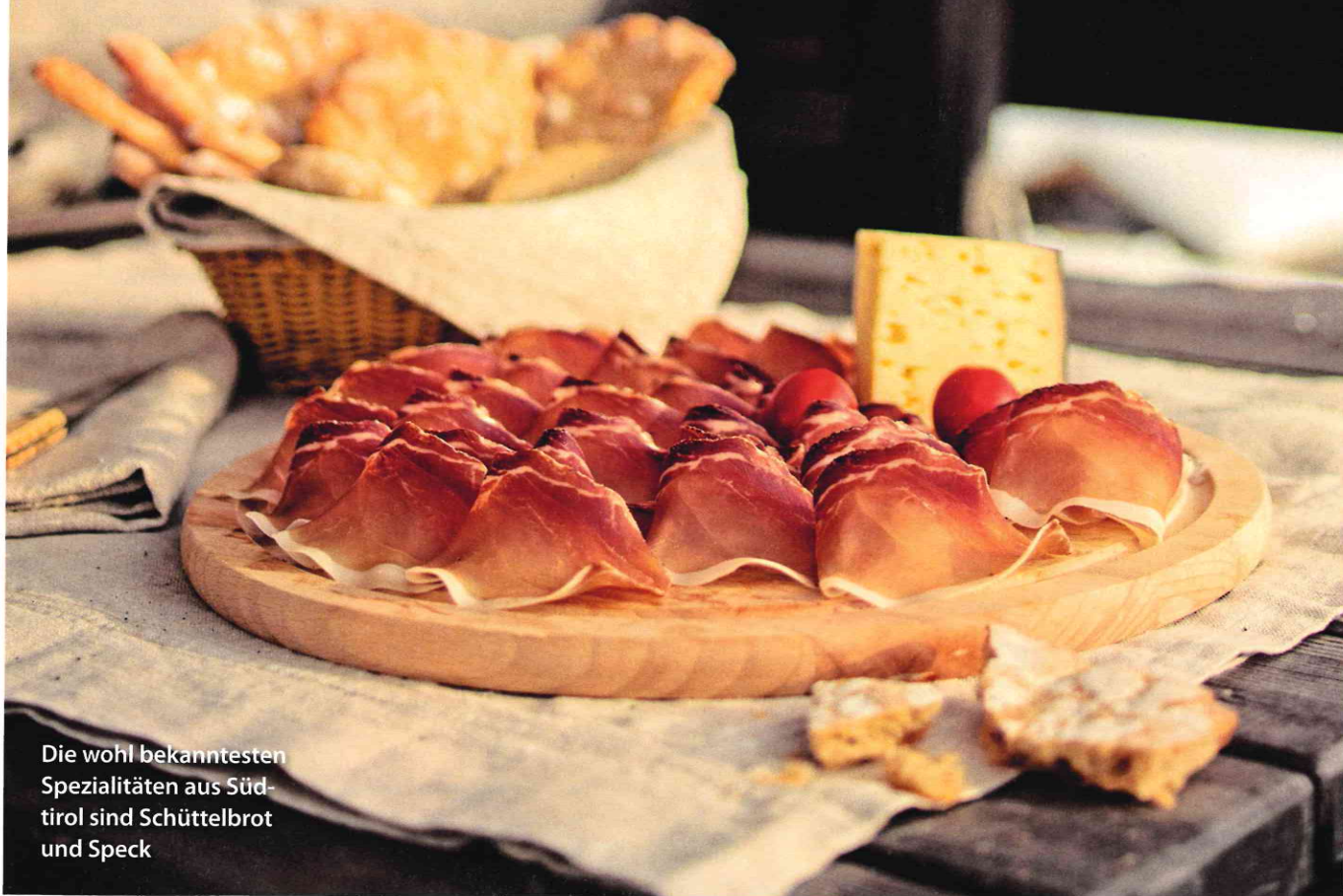
Die wohl bekanntesten Spezialitäten aus Südtirol sind Schüttelbrot und Speck