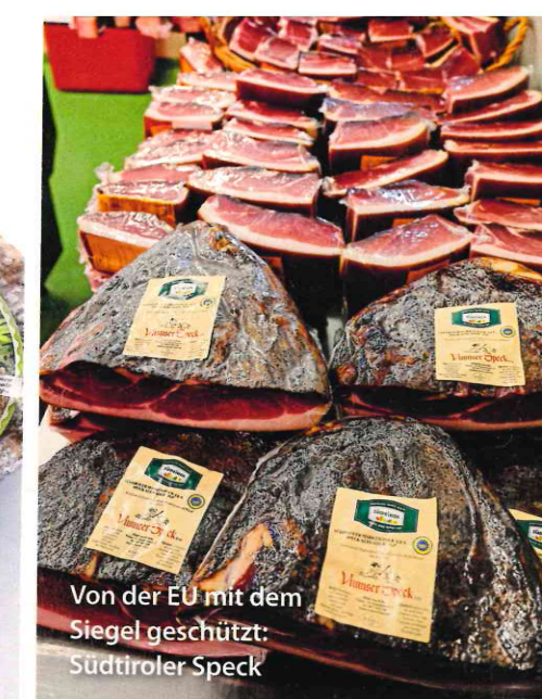
Von der EU mit dem Siegel geschützt: Südtiroler Speck