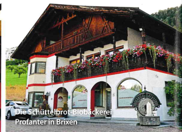
Die Schüttelbrot-Biobäckerei Profanter in Brixen

52-Jährige für das Metzgerhandwerk entschieden, denn sein großer Erfahrungsschatz, die Liebe zum Produkt und viel Zeit – das sind wohl die besten Zutaten für sein kulinarisches Aushängeschild.