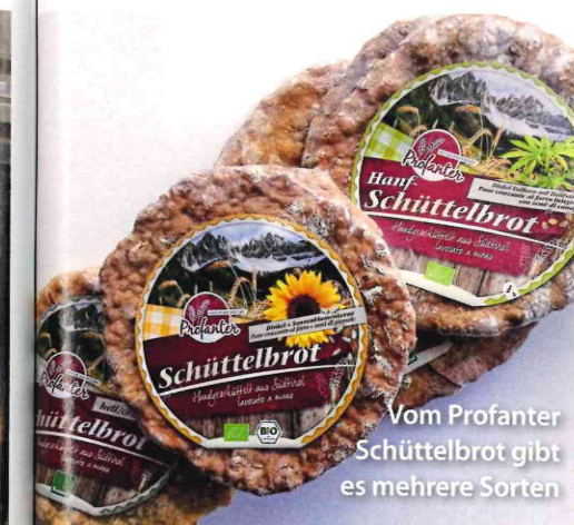
Vom Profanter Schüttelbrot gibt es mehrere Sorten