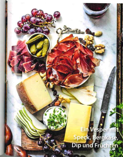
Ein Vesper mit Speck, Bergkäse, Dip und Früchten

Damit sind wir schon bei der zweiten Südtiroler Spezialität. Schüttelbrot ist ein ganz schön harter Brocken! Woran erkennt man einen Südtiroler-Neuling?